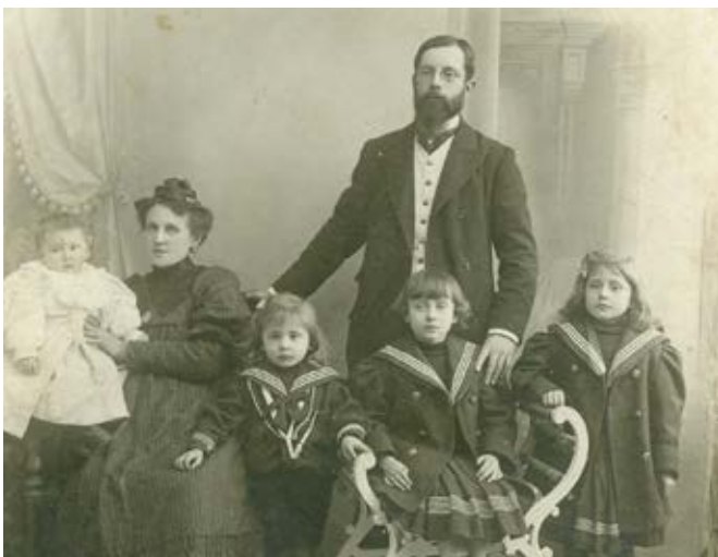
Het gezin Causse, eind 19de eeuw.

In de 19de-eeuwse burgerij, zeker de hogere burgerij, verdienden mannen genoeg om hun gezin te onderhouden. Het werd een teken van prestige wanneer de vrouw thuis kon blijven. Het model sloot ook perfect aan bij de ideeën die wetenschappers (ook uit de burgerij) verspreidden over de mannelijke en vrouwelijke 'natuur'.