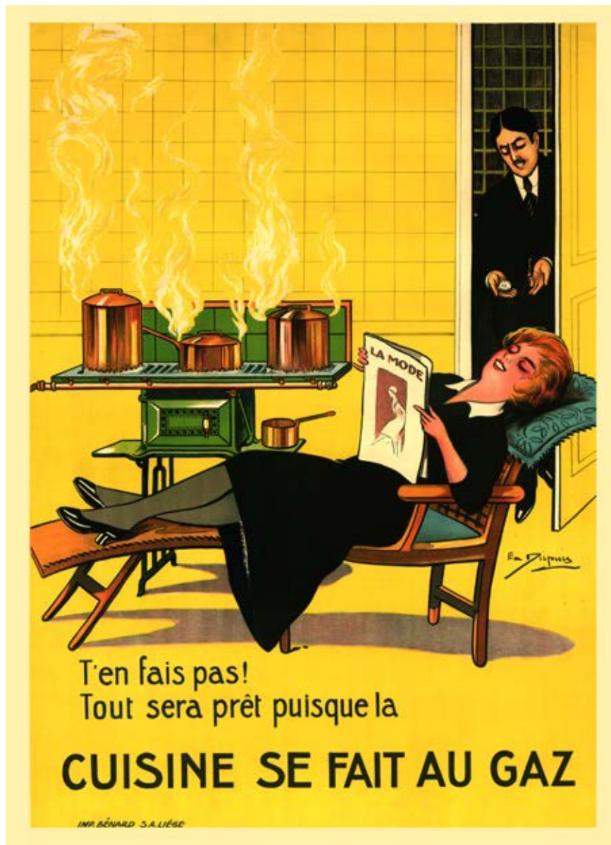
Het kostwinnersgezin in de reclame: "Geen zorg! Alles zal op tijd klaar zijn, want ik kook op gas." Affiche, interbellum. Stadsarchief Brussel.