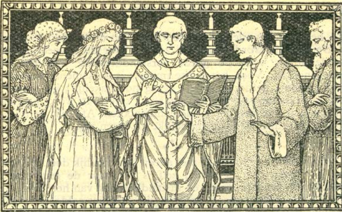
'Het huwelijk', uit Het sacramentsboekje, Abdij Keizersberg, 1913.

Anno 2012 stelt de katholieke kerk niet langer dat mannen superieur zijn aan vrouwen: hij noemt mannen en vrouwen gelijkwaardig (maar niet gelijk). Alleen mannen kunnen priester worden en leidend functies in de kerk bekleden.