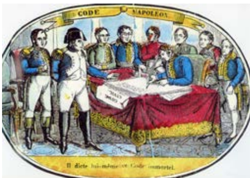
Napoleon dicteert het burgerlijk wetboek, Epinalprint, ca. 1830, afgebeeld in Les grands événements de l'histoire des femmes , Larousse, Parijs, 1993, p. 209.

Ook vóór de 19de eeuw beschreven wetenschappers verschillen tussen mannen en vrouwen, maar ze hechtten daar minder belang aan. In de 19de eeuw nam de wetenschappelijke interesse in man/vrouw-verschillen sterk toe (zie ook 'Eén sekse of twee?'). De verschillen kregen ook meer gewicht: mannen en vrouwen hadden vanuit hun biologie een natuurlijke aanleg voor bepaalde taken, zo klonk het. Daarom zorgden vrouwen best voor kinderen en huishouden, en waren wetenschap, economie en politiek het terrein van mannen.